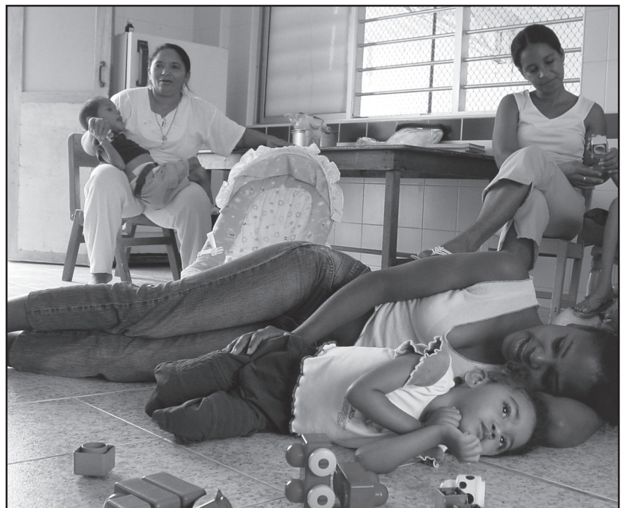
CE Camilo Barranquilla.

Zoals u elders in dit nummer kunt lezen zijn de mantelzorgwoningen klaar en zijn de eerste bewoners al ingetrokken.